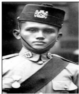
Leftenan Adnan Saidi